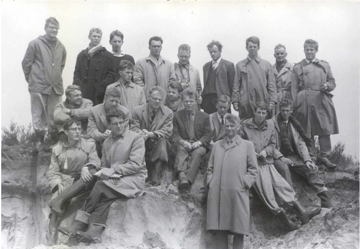
Werkgroep Veldpracticum regionale bodemkunde (‘zandpracticum’), de Lollebeek 1962.

De onderstaande foto is ons ter beschikking gesteld door de vakgroep Bodemkunde en Geologie van de WUR, met dank aan Thea van Hummel (foto) en Piet van Reeuwijk (informatie). De mannen met stropdas en regenjas zijn op deze foto vastgelegd tijdens het veldpracticum regionale bodemkunde in het dal van de Lollebeek in 1962 in de Heydse Peel in Limburg. Dit practicum –ook wel bekend als het ‘zandpracticum’ duurde vier weken. Studenten en leiding waren gehuisvest in een ‘DUW’-kamp (Dienst Uitvoering Werkzaamheden), nabij IJsselsteijn. De studenten deden studies en maakten veldbeschrijvingen in groepjes. De groepen presenteerden hun veldwerkzaamheden op locatie tijdens de ‘slot-excursie’ waarbij de prof, studenten en personeel van de vakgroep op bezoek kwamen.