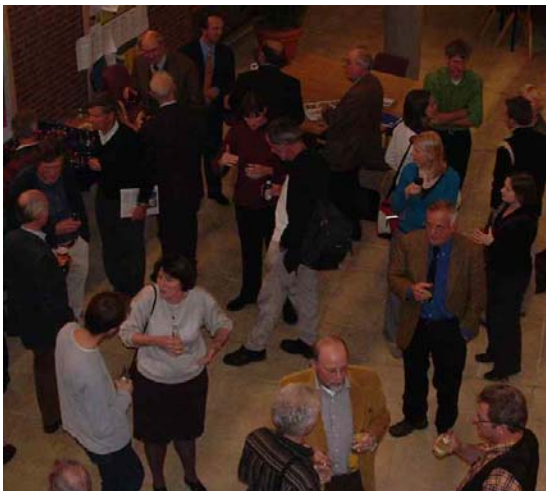
Napraten over de 135 e themadag

De afsluitende discussie onder bekwame leiding van de dagvoorzitter ging over het belang van bodem- en landschapsinformatie voor natuurontwikkeling en het gebrek aan interesse/belang bij de betreffende instanties (provincies). Er wordt namelijk erg veel gepraat in termen van natuurdoeltypen maar daarin komt de bodem en het landschap niet direct tot uitdrukking. Zo zou er eigenlijk een soort rode lijst voor aardkundige waarden moeten komen. Al met al was het een levendige discussie ter afsluiting van deze interessante themadag. Voor wie deze dag gemist heeft en toch graag de presentaties wil zien kunnen deze worden gedownload van de NBV-website ( www.bodems.nl ).